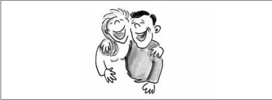
Abb. 1-2 Miteinander lachen

meist unwillkürlich sowie unfreiwillig und kann nur mit Mühe unterdrückt werden, wenn z. B. die Situation unpassend ist.