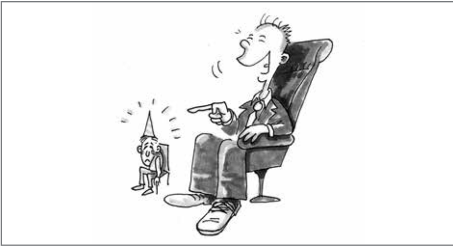
Abb. 1-3 Aggressives Lachen

Und dass dies nicht sein kann, weil es nicht sein darf und gefährlich ist, wissen wir! Auffallend ist, dass in Staaten, in welchen ein diktatorisches System herrscht, das Lachen zu unterbinden versucht wird. Auch wird Lachen in manchen Organisationen und Institutionen, die hierarchisch geführt und obrigkeitshörig ausgerichtet sind, nicht geduldet. Die Angst, ver- oder ausgelacht und dadurch nicht mehr ernst genommen zu werden oder einen Machtverlust zu erleiden, ist zu groß, um Lachen positiv aufgreifen und kommunikationsfördernd schätzen zu können. Die Waffe der Untergebenen gegen diese Systeme zeigt sich in Form von Witzen – »Flüsterwitze«, die gerade dann aufblühen und hinter verborgener Hand kursieren.